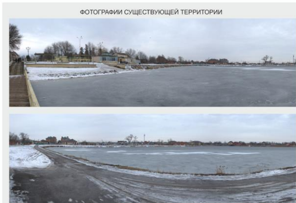
ФОТОГРАФИИ СУЩЕСТВУЮЩЕЙ ТЕРРИТОРИИ